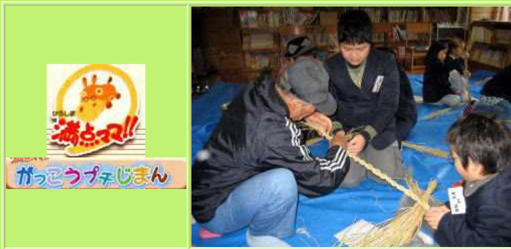
テレビ新広島(TSS) ひろしま満点ママ!! 広島県内の小学校めぐり『がっこうプチじまん』 (2009年1月26日(月)放送)

テレビ新広島(TSS)の方には、少人数教育に注目いただき、ことあるごとに取材して頂いています。竹原市の素晴らしい少人数教育を、県内各地に情報発信して頂いています。