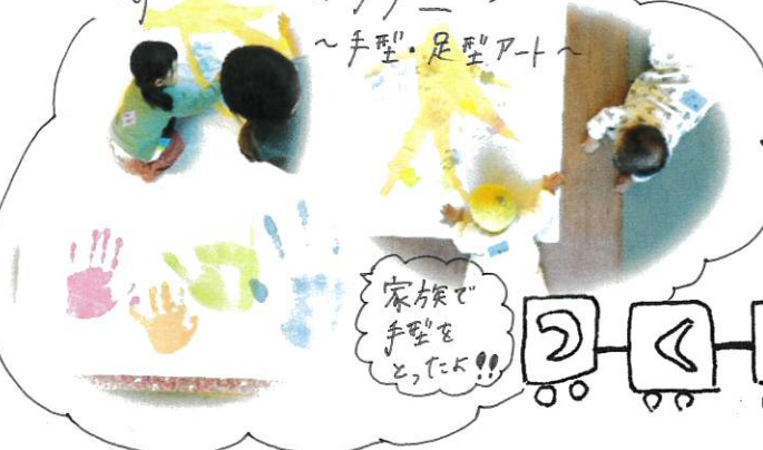
家族で手型をとったよ!!