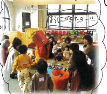
せつばん～まめまき～

寒暖差が激しい日々が続いていますが、春休みまで元気に楽しく過ごしてほしいと思います。