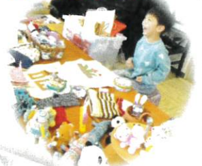
いのちのおはなし会