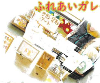
ふれあいガレージマルシェ