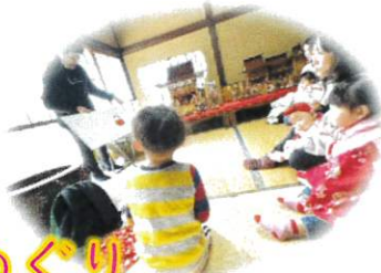
0・1歳ちゃんひろば