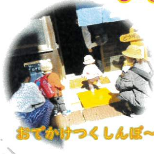
おでかけつくしんぼ～吉田屋～